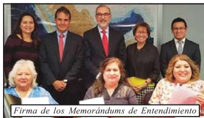
Firma de los Memorándums de Entendimiento

Las acciones que ha desarrollado el área de protección, son: "Trabajar en algunos lugares con autoridades locales en donde hay un ambiente favorable y los agentes locales de tránsito no están deteniendo a nuestra gente o no los envían a los centros de procesamiento directamente, sino que les dan un tiempo para tomar una decisión. También estamos contratando a varias instituciones para que nos hagan los diagnósticos migratorios, está demostrado que si un agente tiene una asesoría adecuada por parte de un abogado de migración, en un 20% de los casos se puede encontrar alternativa para que no sean deportados. Además, estamos contratando en algunos lugares a abogados de migración para que nos acompañen a los centros de detención, cárceles y penitenciarias para