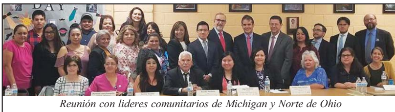
Reunión con líderes comunitarios de Michigan y Norte de Ohio

y desafortunadamente no se va acabar pronto, tenemos el caso más dramático que es la separación de los niños, yo no sé hasta dónde más se pueda llegar pero necesitamos estar preparados para todo. Debemos dar los mejores elementos a nuestra comunidad de tal suerte que puedan defender los intereses de la familia".