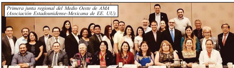
Primera junta regional del Medio Oeste de AMA (Asociación Estadounidense-Mexicana de EE. UU.).

fin de contrarrestar comentarios negativos en nuestras comunidades a través de la difusión de historias de éxito, perseverancia, y determinación, demostrando el espíritu de los miembros.