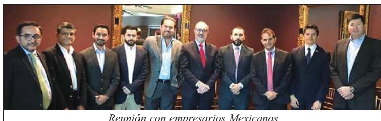
Reunión con empresarios Mexicanos