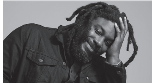
Keynote Speaker: Jason Reynolds