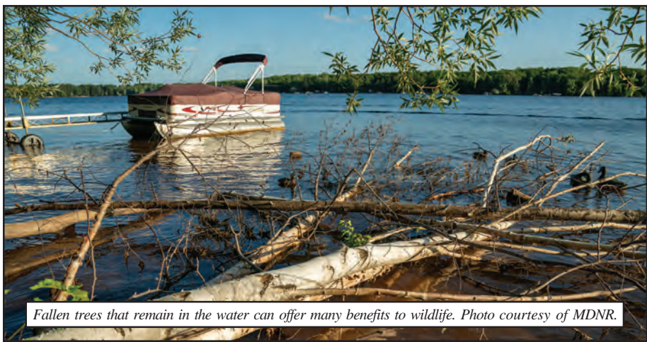
Fallen trees that remain in the water can offer many benefits to wildlife.