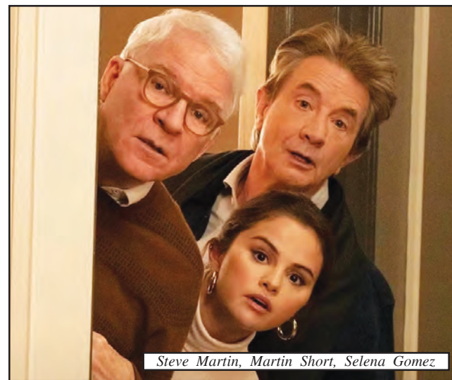
Steve Martin, Martin Short, Selena Gomez.

se creó en 2019 para homenajear a aquellos que han “hecho contribuciones dentro o fuera de pantalla”.