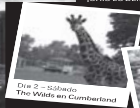
Día 2 - Sábado The Wilds en Cumberland